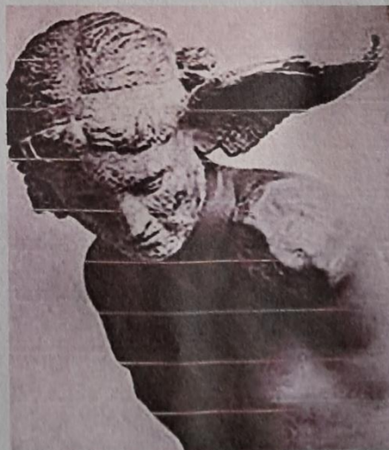
Britské muzeum, odbor řeckých a římských starožitností